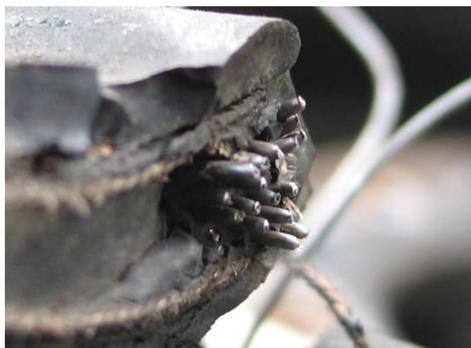
Bild 4: Bruchflächen des Wulstkernes mit deutlichen Einschnürungen