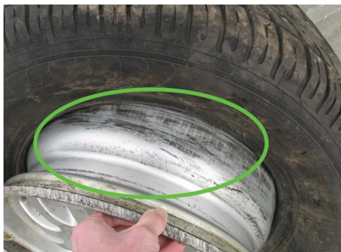
Bild 6: Felgenschulter innen, korrespondierend zu den Überhitzungsspuren an der inneren Wulstsohle