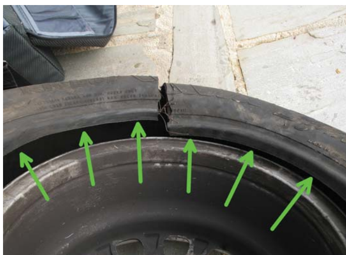
Bild 7: keine Überhitzungsspuren an der inneren Wulstsohle im Schadensbereich

gebrochener Wulstkern kann den festen Sitz des Reifens auf der Felge nicht gewährleisten und schränkt somit die Fahrsicherheit drastisch ein. Insbesondere besteht die Gefahr, dass ein angebrochener Wulstkern beim weiteren Fahrbetrieb reißt und der Reifen schlagartig aufbricht (platzt).