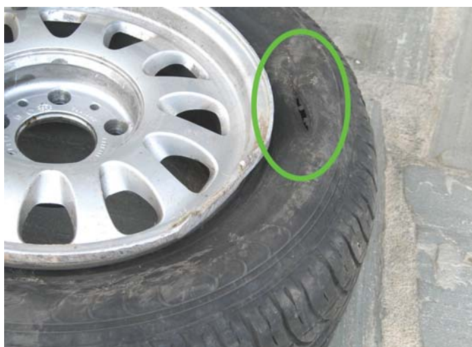
Bild 1: Rad hinten links, Außenseite mit durchgeschliffener Flanke

Bei einem Bruch des Wulstkernes sind äußerlich keine Spuren erkennbar. Ein